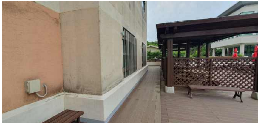
송강학숙 2호관 정면 테라스