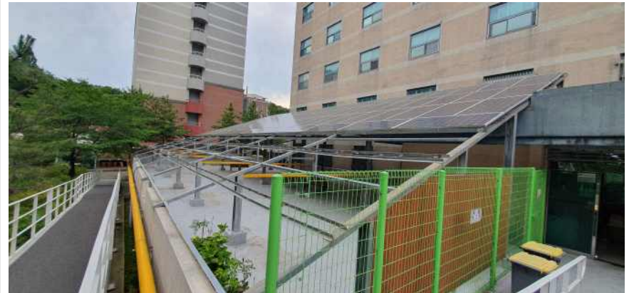
송강학숙 2호관 배면 테라스