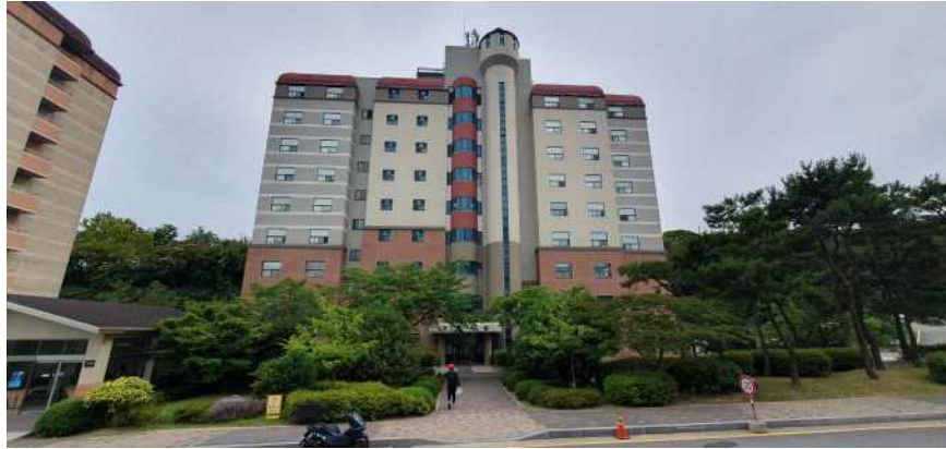
송강학숙 1호관(리모델링 기준)