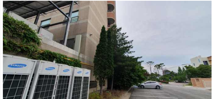
송강학숙 2호관 좌측면 수목 간섭 현황