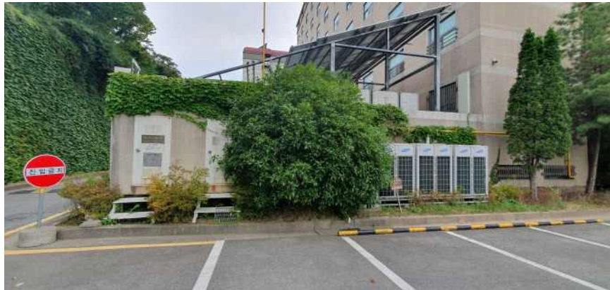
송강학숙 2호관 정압기실