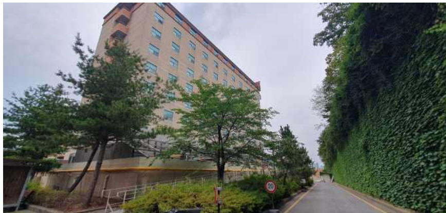
송강학숙 2호관 배면