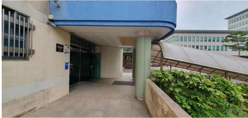
송강학숙 2호관 1층 출입구