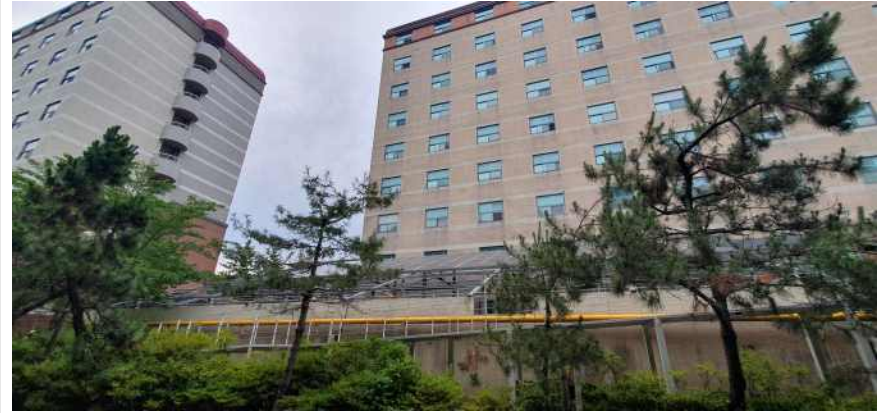
송강학숙 2호관 배면