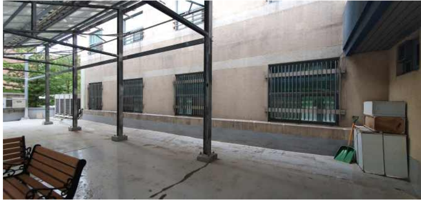
송강학숙 2호관 배면 테라스