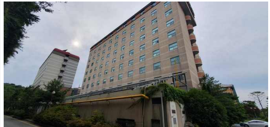
송강학숙 2호관 배면