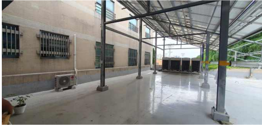
송강학숙 2호관 배면 테라스