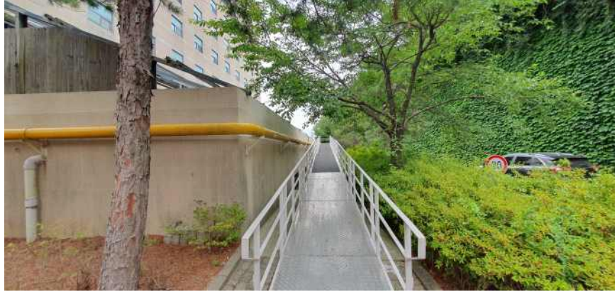
송강학숙 2호관 후면 경사로