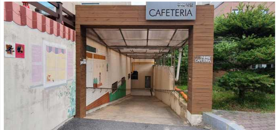
송강학숙 2호관 지하 출입구 경사로