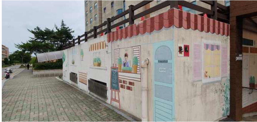
송강학숙 2호관 전면 상세