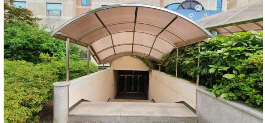
송강학숙 2호관 지하 출입구 계단