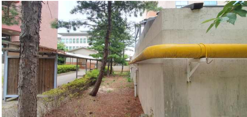
송강학숙 2호관 우측면