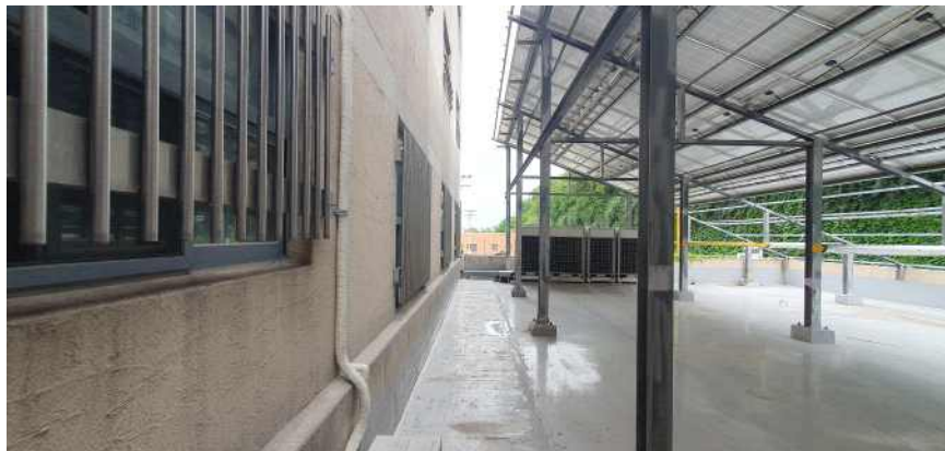
송강학숙 2호관 배면 테라스