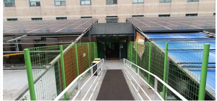
송강학숙 2호관 후면 경사로