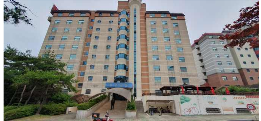
송강학숙 2호관 정면