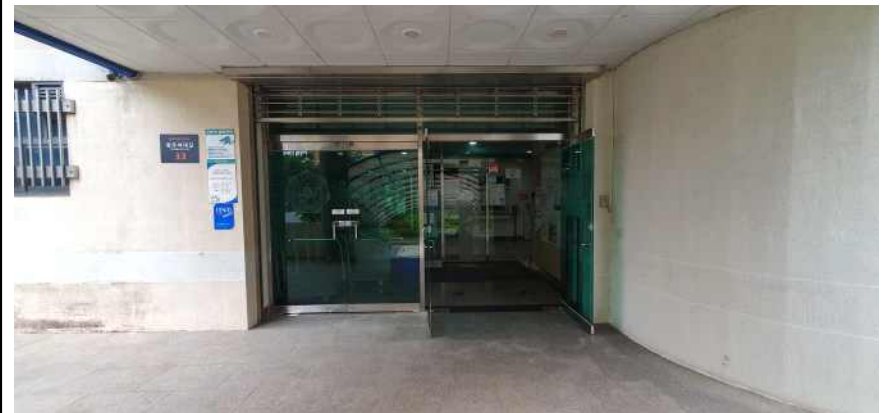
송강학숙 2호관 1층 출입구