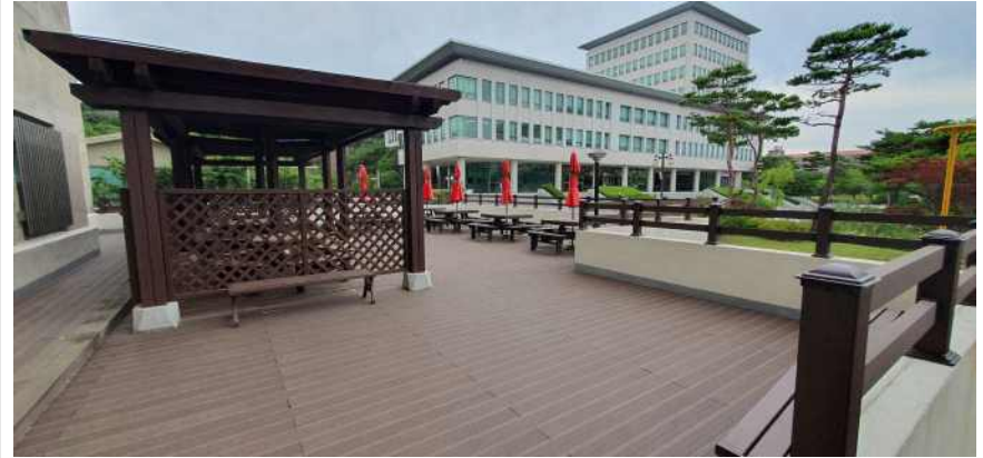
송강학숙 2호관 정면 테라스