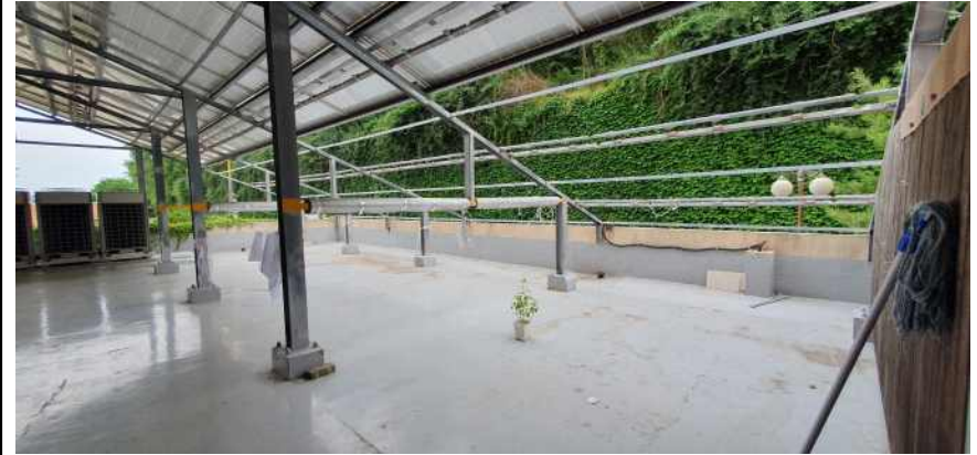
송강학숙 2호관 배면 테라스