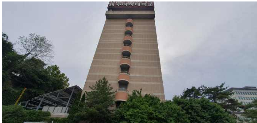
송강학숙 2호관 좌측면