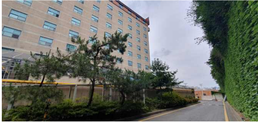
송강학숙 2호관 배면