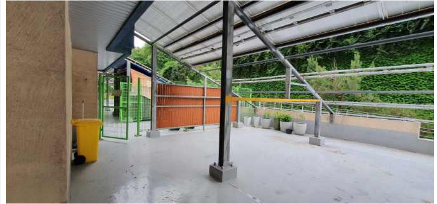
송강학숙 2호관 배면 테라스