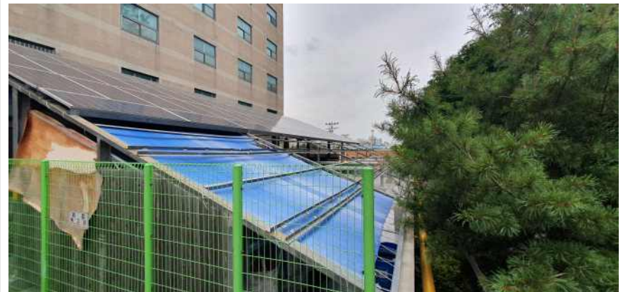
송강학숙 2호관 배면 테라스