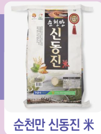
순천만 신동진 쌀