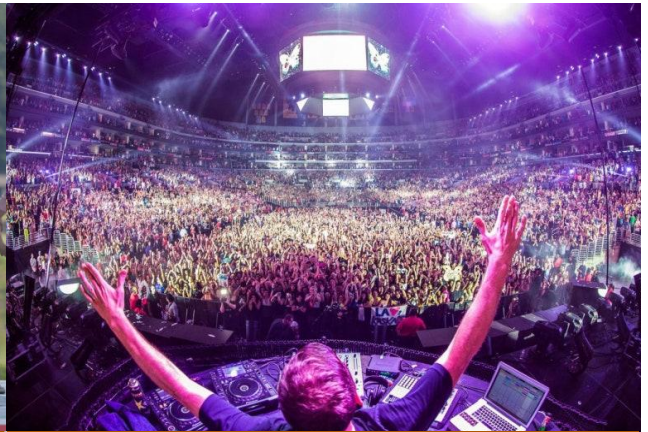
EDM 댄스 파티