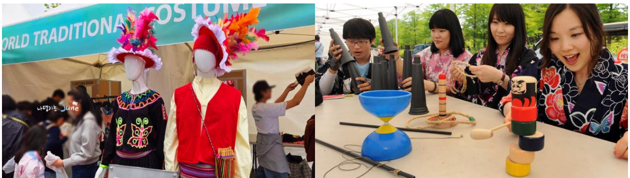
‘21개국 홍보관’ 운영 예시