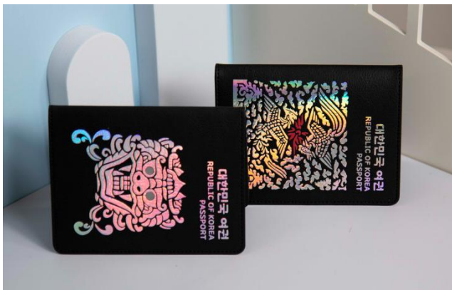
기념품 1안) 자개 여권 케이스