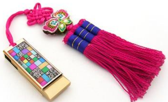
기념품 2안) 솔고리 USB