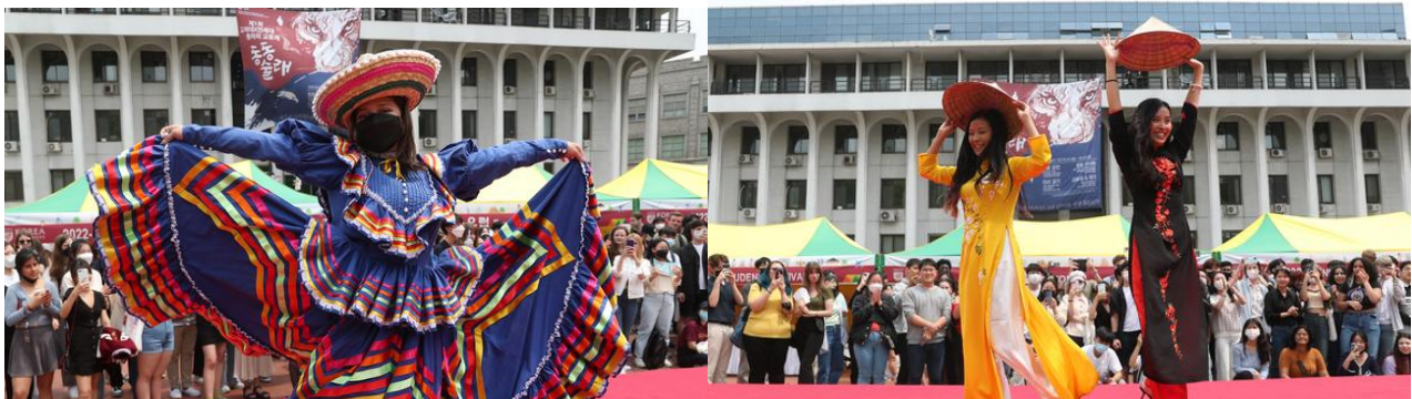
‘APEC 스마일 콘테스트’ 운영 예시