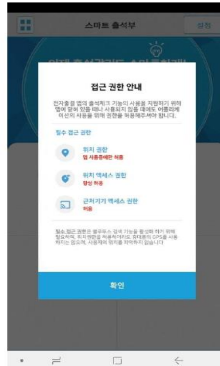
3) 위치정보 및 사진 미디어 파일 권한 - [허용]선택 위치데이터의 사용 권한을 항상 허용 이 필요