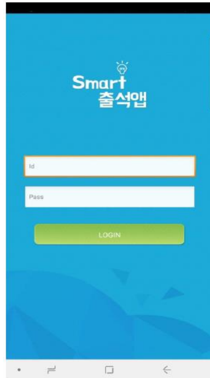
2) ID : 대학교 포털 ID 비밀번호 : 대학교 포털 로그인 비밀번호 입력 후 로그인