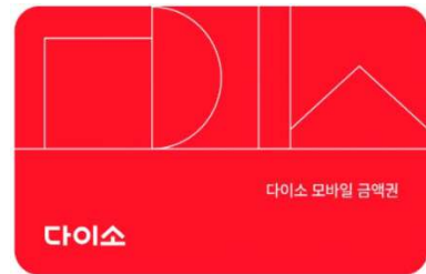
다이소 모바일상품권 (5,000원)